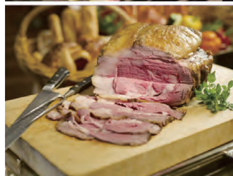
【メニューイメージ】

浅草ビューホテル TEL (03) 3847-1111 https://www.viewhotels.co.jp/asakusa