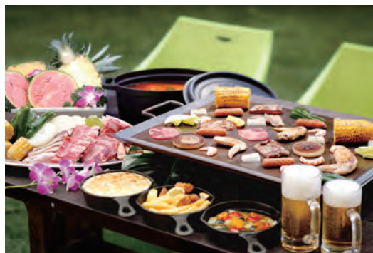
【ガーデンバーベキューイメージ】