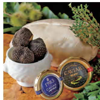
【世界三大珍味イメージ】