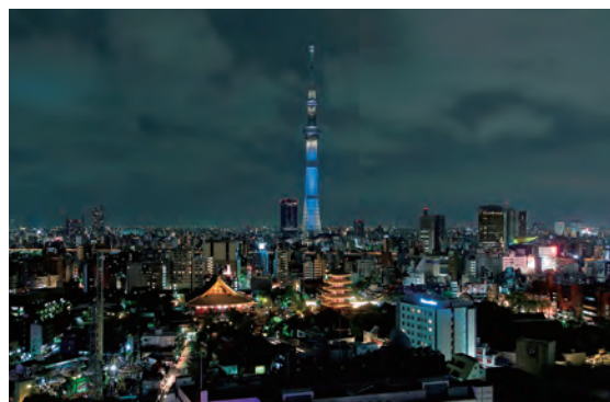
【東京スカイツリー®】

ご予約・お問い合わせ 浅草ビューホテル 宿泊予約課 TEL 03-3842-4890（受付 10:00～18:00）