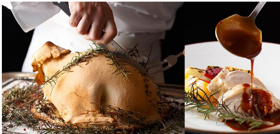
【若鶏の塩パイ包み焼き イメージ】

今回のバイキングに合わせ、新メニューを考案！岩塩・ピンクペッパー・タイム・ローズマリーを使い一羽丸ごとパイ生地で包みこむことで、本来の旨みを逃がさず加熱し、柔らかくジューシー仕上がります。お一人ずつカッティングサービスにてご提供いたします。