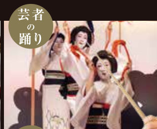
芸者 の 踊り