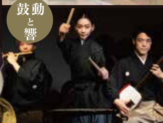
鼓動 と 響