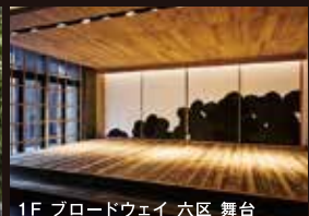
1F ブロードウェイ 六区 舞台