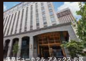
浅草ビューホテル アネックス 六区