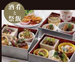
酒肴 と 祭飯