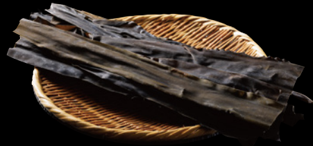
北海道産 天然昆布 Natural kelp from Hokkaido

北海道道南地方の真昆布。昔から非常に良い出しが取れることで利用されている。利尻昆布と比べるとやや甘口で風味と上品さに優れている。出し昆布・高級佃煮用（主に白口浜天然元揃）として以外に、神社仏閣でのお飾り用や求肥昆布の原料（主に折昆布）など様々な用途で使用されます。