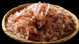
高知県「土佐清水市」の 宗田節 Souda Bushi from Tosashimizu City, Kochi

This is the Japanese kelp from the southern region of Hokkaido. It has been used for making excellent broth since ancient times. This type of kelp is slightly sweeter and more elegant in taste and aroma than Rishiri kelp. It is used for various purposes, such as making dashi kelp, high-end tsukudani (which mainly uses natural elements from Shirokuchi beach), decorating shrines and temples, and as a raw material for making mochi kelp (mainly using ori kelp).