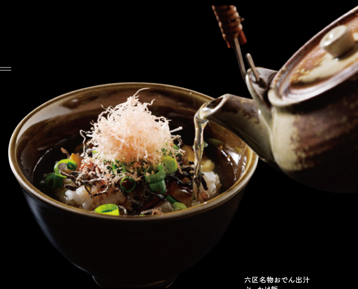
六区名物おでん出汁 ぶっかけ飯

〔メの逸品〕 六区名物おでん出汁 ぶっかけ飯 ..... ¥650 Rokku specialties Rice topped with oden soup stock