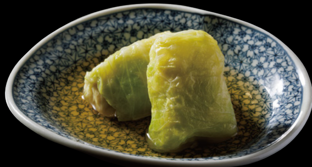
ロールキャベツのおでん