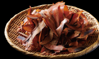
鹿児島県「枕崎市」の 鰹節 Katsuobushi from Makurazaki City, Kagoshima

Sodabushi is a type of bonito flake that is made from the Soudagatsuo species of bonito fish. These flakes are known for their stronger umami flavor and aroma than regular bonito flakes. Professional chefs highly appreciate this ingredient for adding depth and richness to dishes. Moreover, sodabushi contains higher levels of various amino acids, including taurine, which is believed to have fatigue-reducing effects that surpass those of regular bonito flakes.