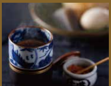
出汁割焼酎セット ¥1,200 Dashi-wari shochu Set