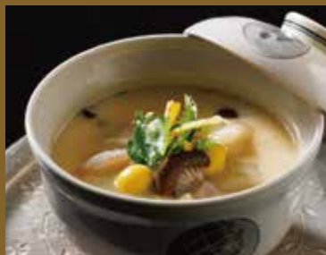
茶碗蒸し ¥850 Savory egg custard

“Golden soup stock” with a traditional taste secret that is full of attention to detail. Adds flavor and aroma to dishes and brings out the deliciousness of the ingredients. Menu using high-quality Japanese-style soup stock original to “Broadway Rokku”. Please enjoy to your heart’s content.