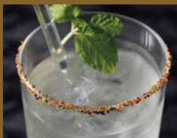
きりきりしゃん ～芸者カクテル～ ¥1,000 Kirikiri-shan