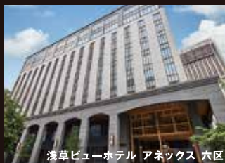
浅草ビューホテル アネックス 六区