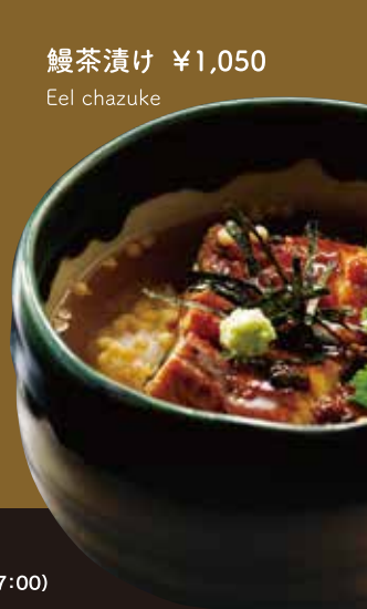
鰻茶漬け ¥1,050 Eel chazuke

※各写真はイメージです。 The photograph is an image.