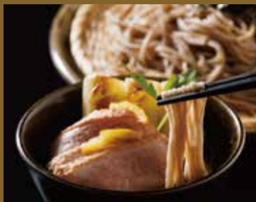
鴨南蛮せいろ ¥1,450 noodles with duck meat and Welsh onions.