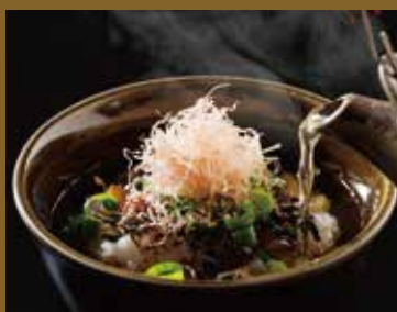
六区名物おでん出汁 ぶっかけ飯 ¥650 Rokku specialties Oden soup stock Bukkake rice