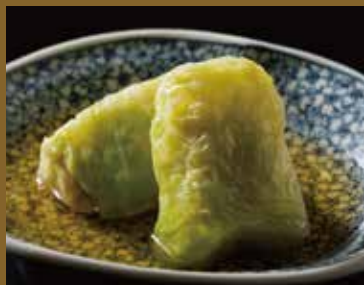
ロールキャベツのおでん ¥580 Cabbage roll oden