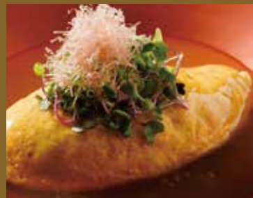
米澤豚と大根炒り煮のだし巻き卵 銀餡仕立て ¥1,050 Yonezawa pork and fried daikon radish rolled in egg with silver bean paste