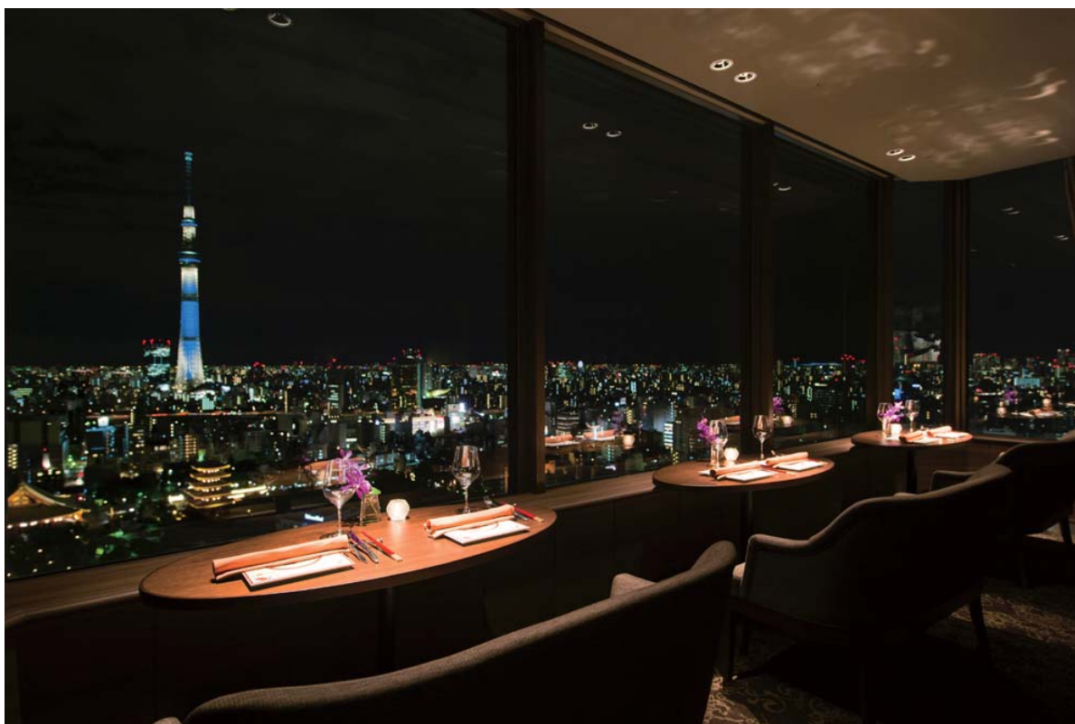
【浅草ビューホテル 27階THE DINING シノワ 唐紅花&鉄板フレンチ 蒔絵 から見た東京スカイツリー®】