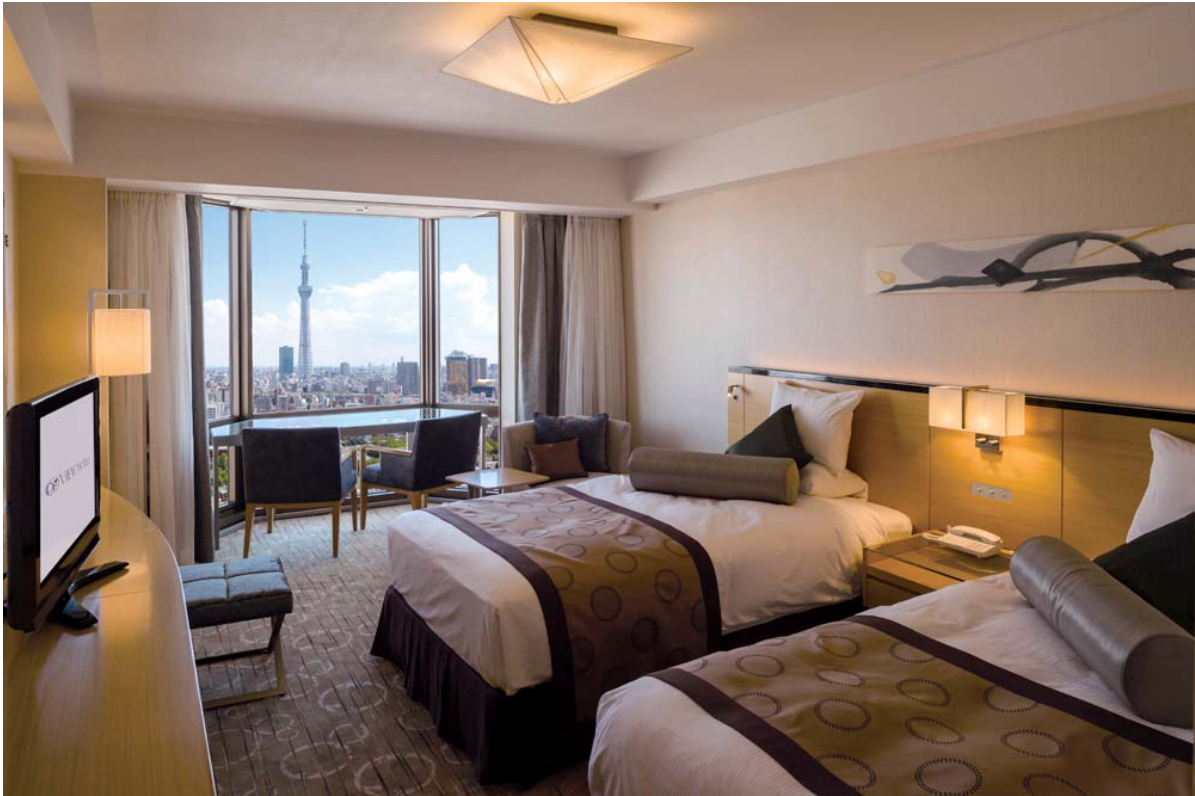
【浅草ビューホテル 客室から見た東京スカイツリー®】