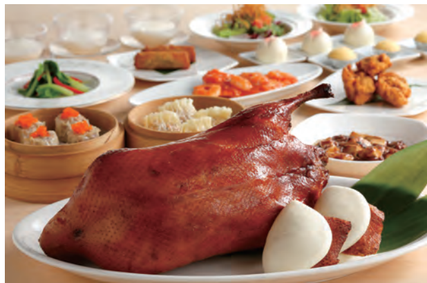
【シェフ&シェフ オーダーバイキング】

高崎ビューホテルのThe Kitchen NOVAでは洋食、中国料理のシェフの饗宴、『シェフ&シェフ オーダーバイキング』を開催いたします。ステーキや北京ダックをはじめ、洋中の人気メニューが大集合! お好きな料理をお好きなだけ、心ゆくまでお楽しみください。