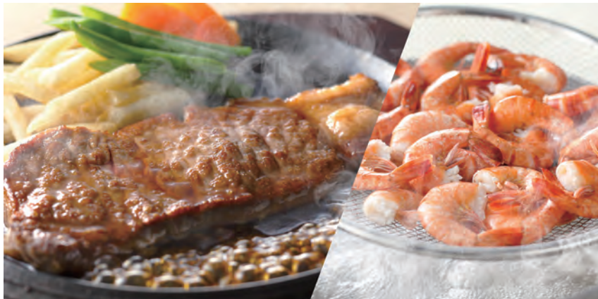
【サーロインステーキと釜揚げ海老イメージ】

秋田ビューホテルの「シノワ&フレンチシェフ&シェフ」ではディナータイム限定でステーキ&釜揚げ海老の食べ放題イベントを開催いたします。熱々、肉厚のサーロインステーキをフンドボーソースで、ぷりぷり食感の海老はバーニャカウダソースとナンプレー風味香味ソースでお好きなだけお楽しみいただけます。