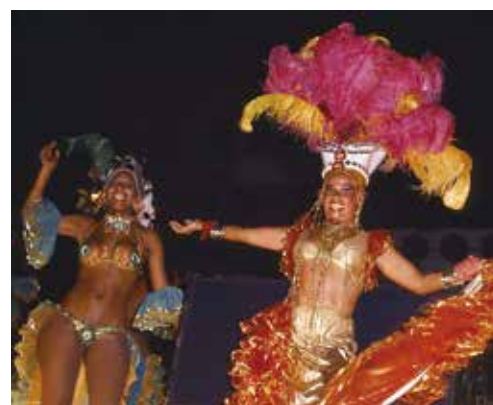
【浅草サンバカーニバル】