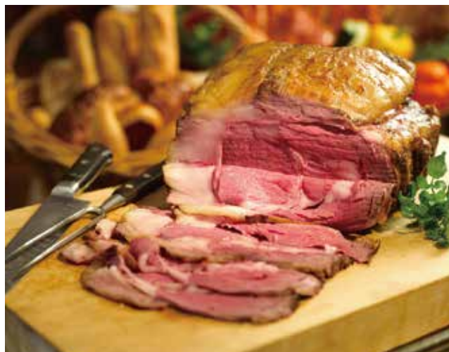
【ローストビーフイメージ】