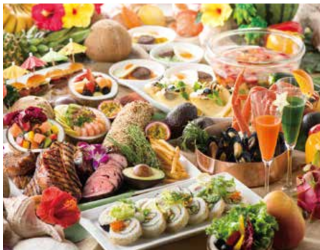
【バイキング料理 イメージ】

※宿泊とセットになったプランもございます。大人お一人様10,500円～23,500円(税・サ込)