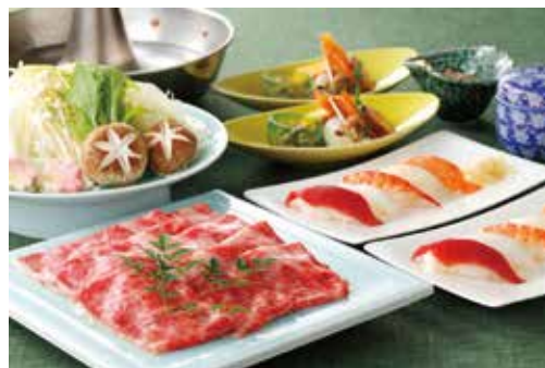
【国産牛しゃぶしゃぶ&握り寿司食べ放題イメージ】

4 レストランによる美味しい夏の競演をコース料理で 楽しみませんか？ 飲み放題付でお得にご用意いたしました。 シーンに合わせて、お好みのコースで夏の ひと時をお過ごしください。