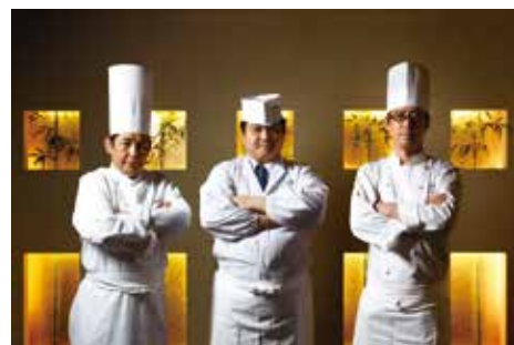
【洋食・和食・中華 料理長】

伊良湖ビューホテル TEL (0531) 35-6111 http://www.viewhotels.co.jp/irako/