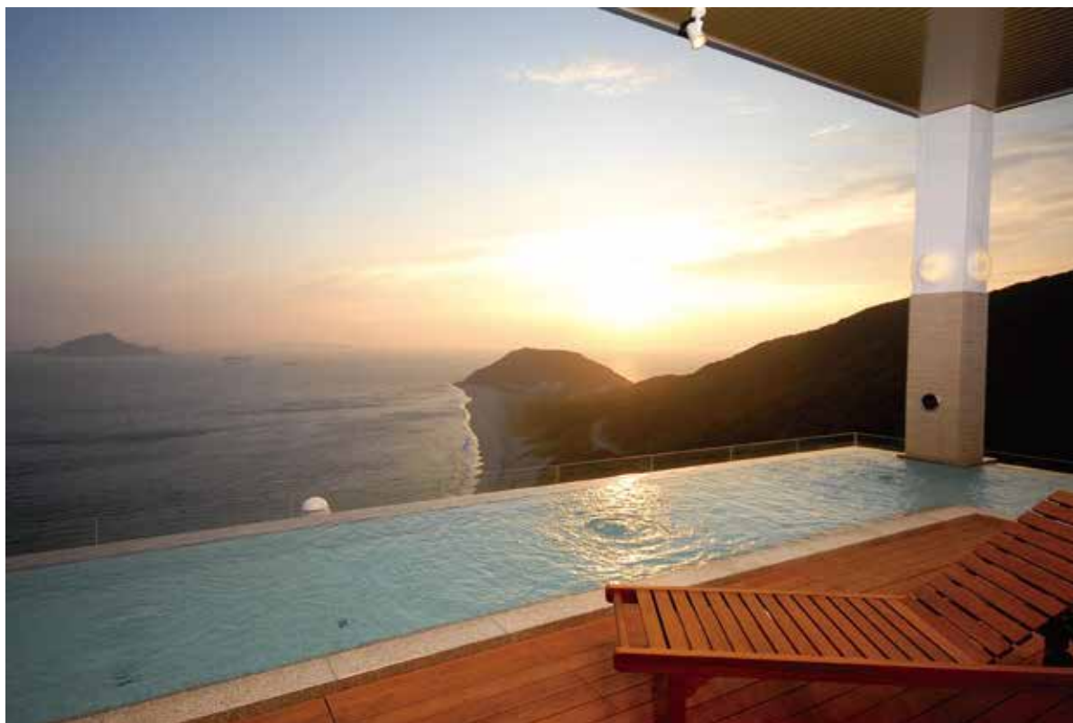
【伊良湖ビューホテル spaview天然温泉露天風呂からの景色】