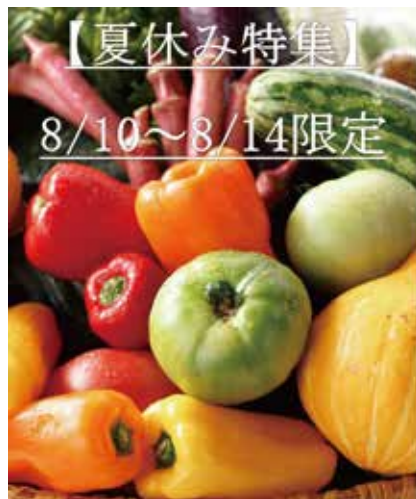
【武藏夏野菜 イメージ】