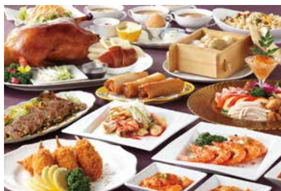
【オーダーバイキング イメージ】

期 間／2015年7月1日(水)から2015年8月31日(月) 料 金／【禁煙】エグゼクティブツインルーム 9,200円～ (税金・サービス料・入湯税込) 特 典／天然温泉入り放題付(通常1回1,500円) 夕 食／ 有 (中国料理「唐紅花」オーダー制バイキング) 朝 食／ 無 ※追加で別途通常2,376円→1,800円(税・サ込)にて、 レストラン「Patio」朝食バイキングをご用意いたします。 チェックイン／14:00～19:00 チェックアウト／11:00 まで