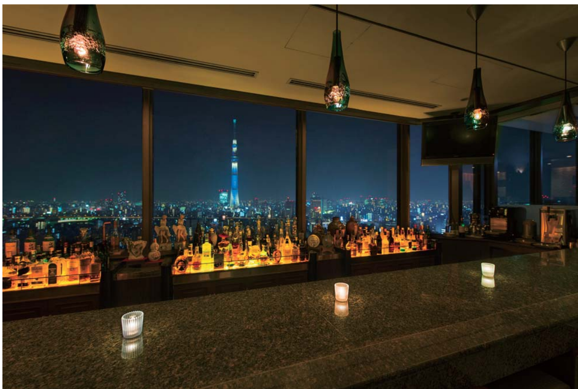
【浅草ビューホテル 28階メンバーズバー「セント・クリスティーナ」から見た東京スカイツリー®】