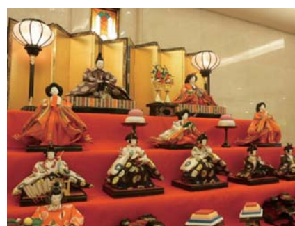
【浅草ビューホテル 雛人形】